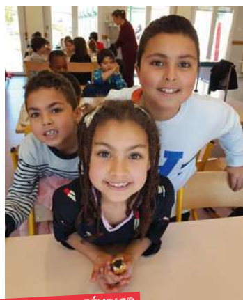
VENDREDI 15 FÉVRIER

Cette première expérience a ravi petits comme grands et a été réalisée grâce à la motivation des animateurs mais aussi du personnel de restauration qui ont fait preuve d'une grande capacité d'adaptation ce jour-là. Nous renouvelerons ce type d'évènements dans les mois à venir pour le plus grand bonheur des enfants.