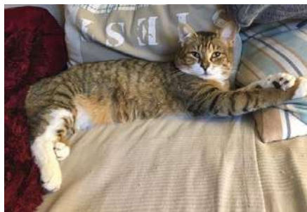
Moustache à adopter

Par ailleurs, si vous voyez une chatte gestante qui semble n'être à personne, ou si vous trouvez des chatons dans la nature, dans votre jardin etc., merci de nous prévenir le plus rapidement possible afin qu'on puisse sortir ces