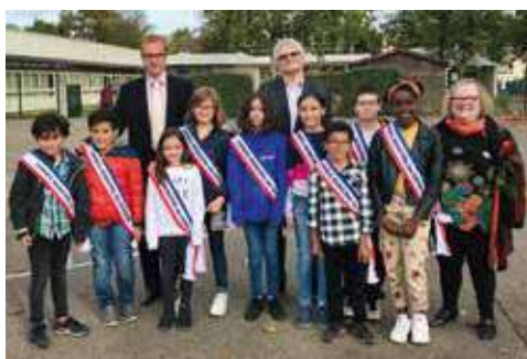
Les nouveaux conseillers municipaux juniors