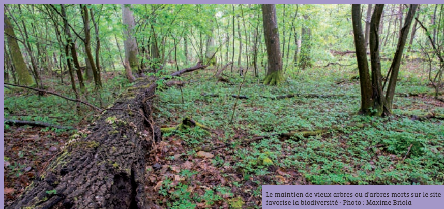
Le maintien de vieux arbres ou d'arbres morts sur le site favorise la biodiversité

Le cardinal est un joli coléoptère des sous-bois frais et ombragés. Il est facilement observable, contrairement à ses larves, aux allures de mille-pattes, vivant sous les écorces décollées des arbres morts. Celles-ci sont carnassières et s'attaquent aux larves des autres insectes, voire à leurs congénères si la nourriture manque.