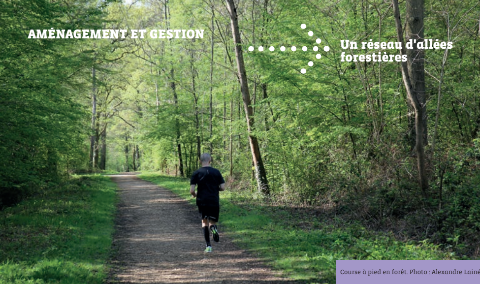
Course à pied en forêt.