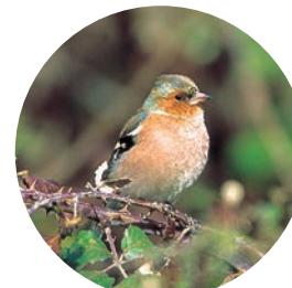
Pinson des arbres

Plusieurs mares, au nord du boisement, constituent des zones humides appréciées des amphibiens (crapauds communs, grenouilles agiles et tritons palmés) et des insectes (libellules, coléoptères...).