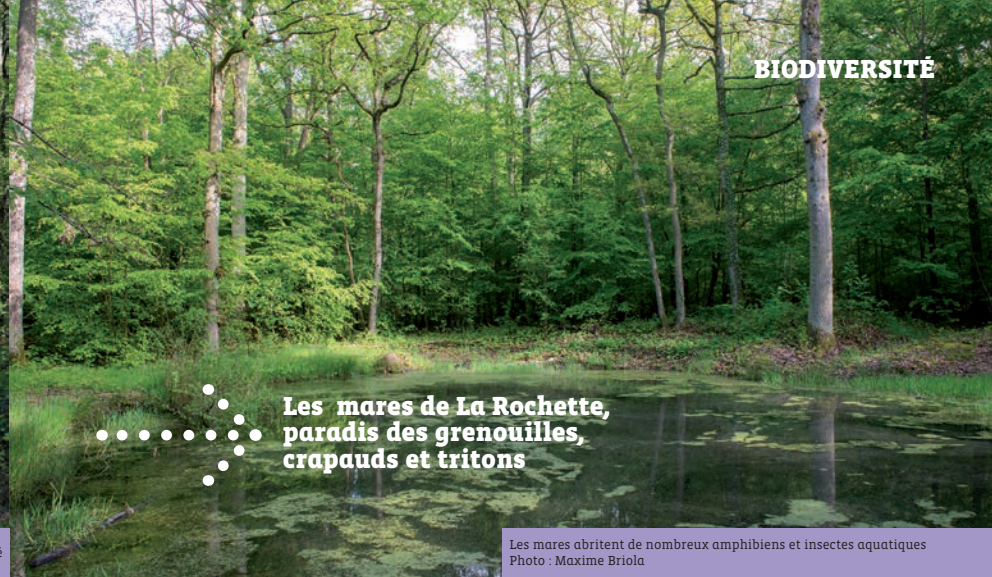
Les mares abritent de nombreux amphibiens et insectes aquatiques