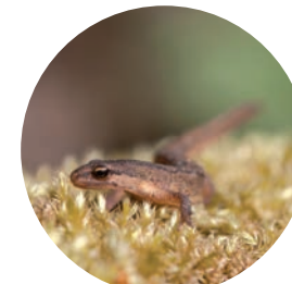
Triton palmé