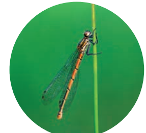
Nympe au corps de feu